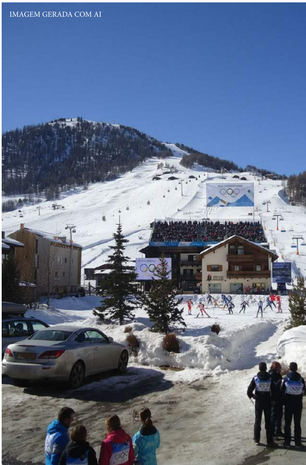
IMAGEM GERADA COM AI