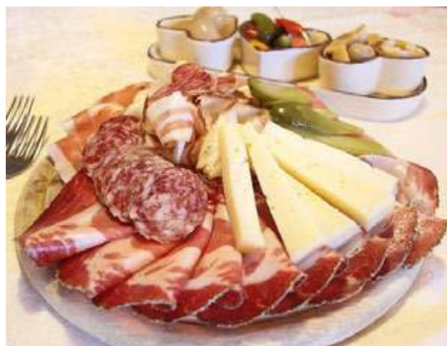
Prato de speck e o típico salame com queijo e pickles

a cidade hospeda festivais locais que celebram a cultura e a culinária, permitindo que os visitantes mergulhem na rica herança alpina e desfrutem de sabores artesanais únicos.