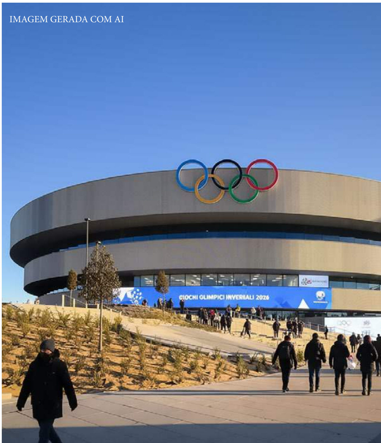
IMAGEM GERADA COM AI

O público pode esperar uma variedade de competições, incluindo esportes como esqui, patinação no gelo, biatlo e hóquei. Além dessas modalidades tradicionais, as Olimpíadas de Inverno de 2026 também enfatizarão a inclusão e a diversidade, com a introdução de novas categorias e a participação de atletas de diferentes origens. Isso representa um passo positivo em direção a um evento mais acessível e representativo para todos. Assim, a edição de 2026 não só celebra o talento atlético, mas também reafirma a importância dos Jogos Olímpicos como uma plataforma para a unidade global e a paz entre as nações.