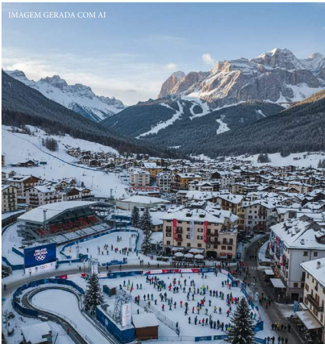
IMAGEM GERADA COM AI

A Milano Rho Ice Hockey Arena não será apenas um espaço de competição, mas um verdadeiro templo do hóquei olímpico, onde cada lance contará uma história e cada vitória será gravada na memória dos torcedores. Em 2026, Milão mostrará ao mundo que o gelo pode ser palco de pura emoção e espetáculo.