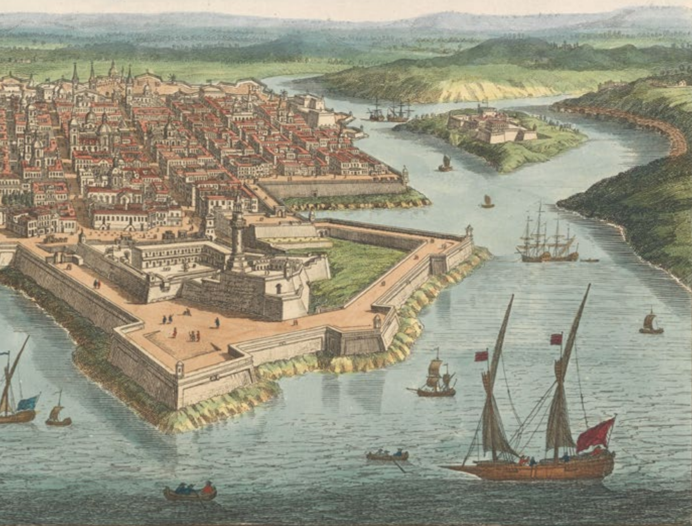
Parliament Vieüe Perspective de la Ville et des Fortifications de MALTA. T. Bowles fecit. Printed & Sold by W. Bowles & Carver, 69, St Pauls Church Yard, London.

A influência britânica também deixou sua marca, especialmente visível nas infraestruturas e no uso difundido da língua inglesa. Cada período histórico, desde as civilizações mais antigas até os tempos modernos, contribuiu para a identidade cultural multifacetada de Malta. Esta rica diversidade histórica não só atrai turistas curiosos, mas também estudiosos e historiadores ansiosos por explorar as camadas complexas que definem esta fascinante ilha mediterrânea.