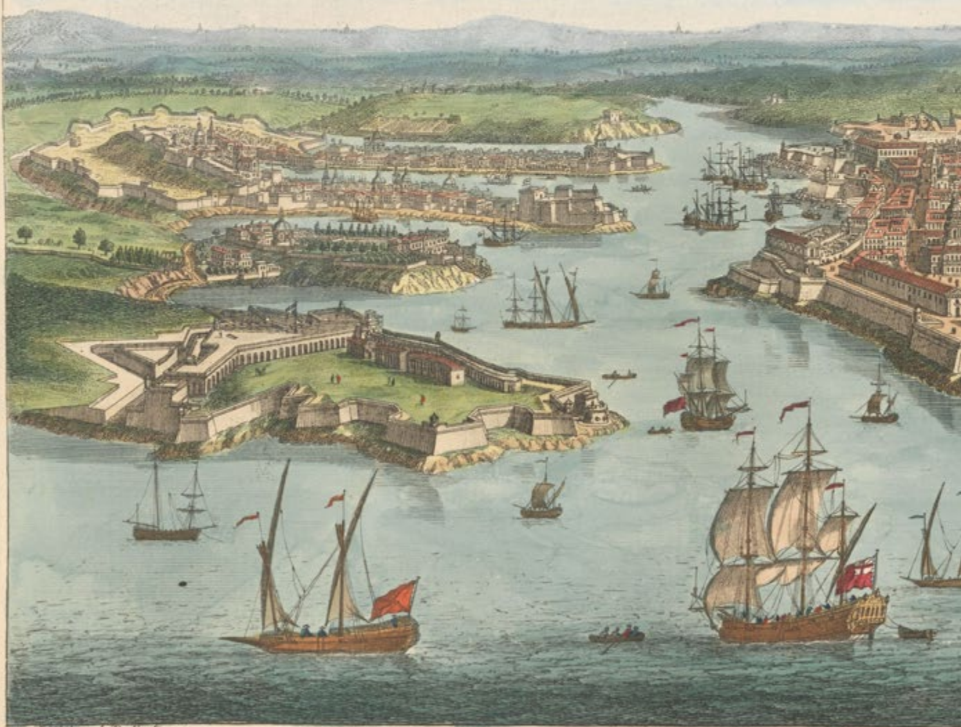
A Perspective View of the Town and Fortifications of MALTA.

A Era dos Cavaleiros de São João marcou um dos capítulos mais memoráveis da história de Malta. Estes cavaleiros, um grupo militar-cristão, receberam a concessão da ilha em 1530 pelo imperador Carlos V. A Ordem de São João construiu algumas das estruturas mais icônicas de Malta, incluindo o