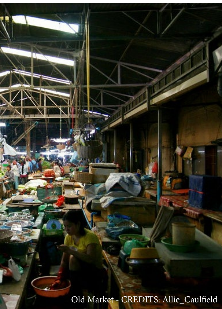
Old Market

decepcionar. Para uma experiência mais autêntica, o Old Market é uma boa escolha para provar a comida da região. Como grande produtor de arroz, os cambojanos têm uma infinidade de pratos elaborados com arroz, como o Lort Cha ou o Nom Banh Chok, algumas das comidinhas de rua mais populares do Camboja. À noite, vale a pena circular pela Pub Street e pelo Angkor Night Market onde os rostos ocidentais já costumam ser maioria. Outro lugar bacana para circular e fazer umas comprinhas é o Siem Reap Art Center Night Market, onde se pode encontrar produtos artesanais e seda. Lá também ocorrem apresentações diárias de espetáculos da dança Apsara, uma dança típica do país realizada por mulheres com movimentos leves e harmoniosos feitos para enfeitiçar os homens, já que as apsaras representam os espíritos divinos femininos.