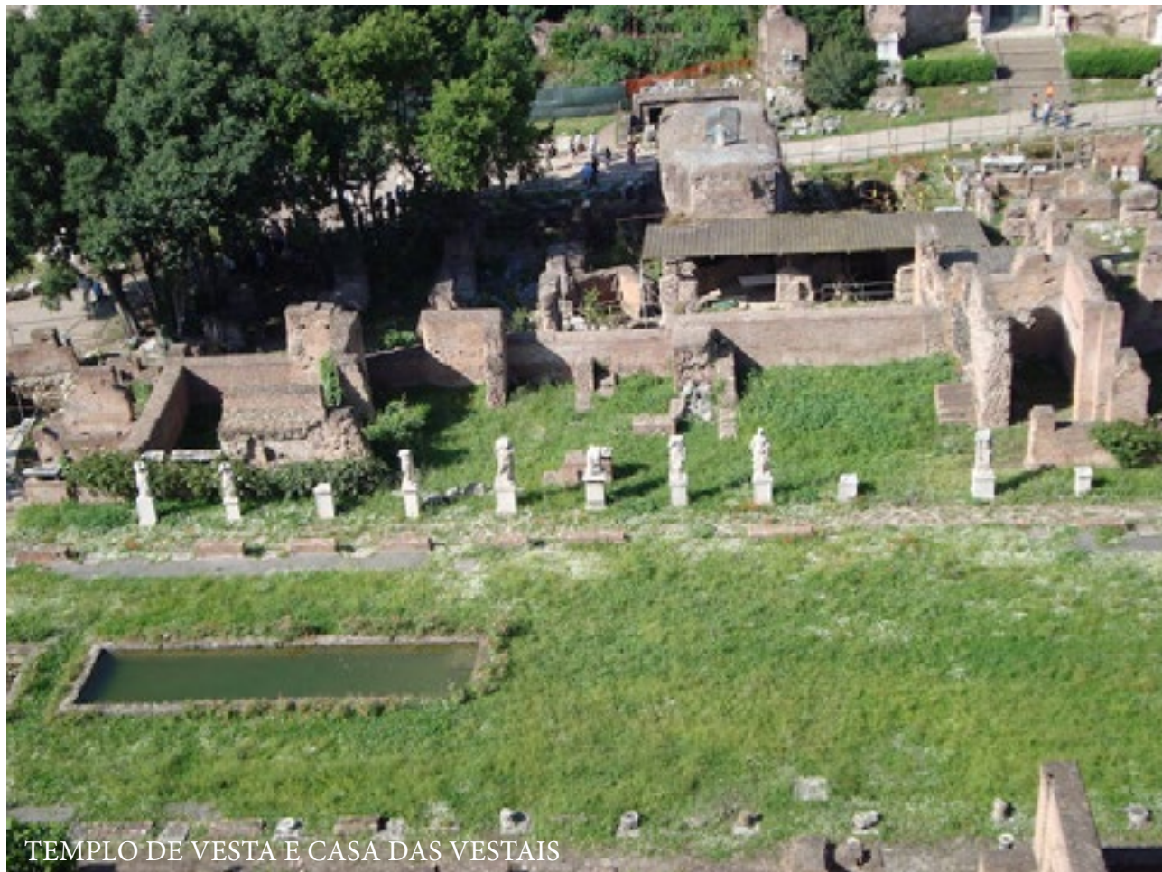
TEMPLO DE VESTA E CASA DAS VESTAIS

A o sul do Circo Massimo, fica um dos monumentos mais bem preservados da Roma Antiga, mas também um dos menos conhecidos pelos visitantes da capital italiana, o complexo de ruínas das Termas de Caracalla. Provavelmente construídas entre 211 e 217 pelos imperadores Sétimo Severo e seu filho Caracalla, que concluiu a obra que viera a receber o seu nome, as Termas de Caracalla chegou a ser o segundo maior complexo de termas da Roma Antiga e foi considerada uma das Sete Maravilhas de Roma, permanecendo em uso por cerca de 3 séculos, até que foi abandonada no século VI. Na Roma Antiga as termas eram abertas aos cidadãos romanos, ou seja, aqueles que